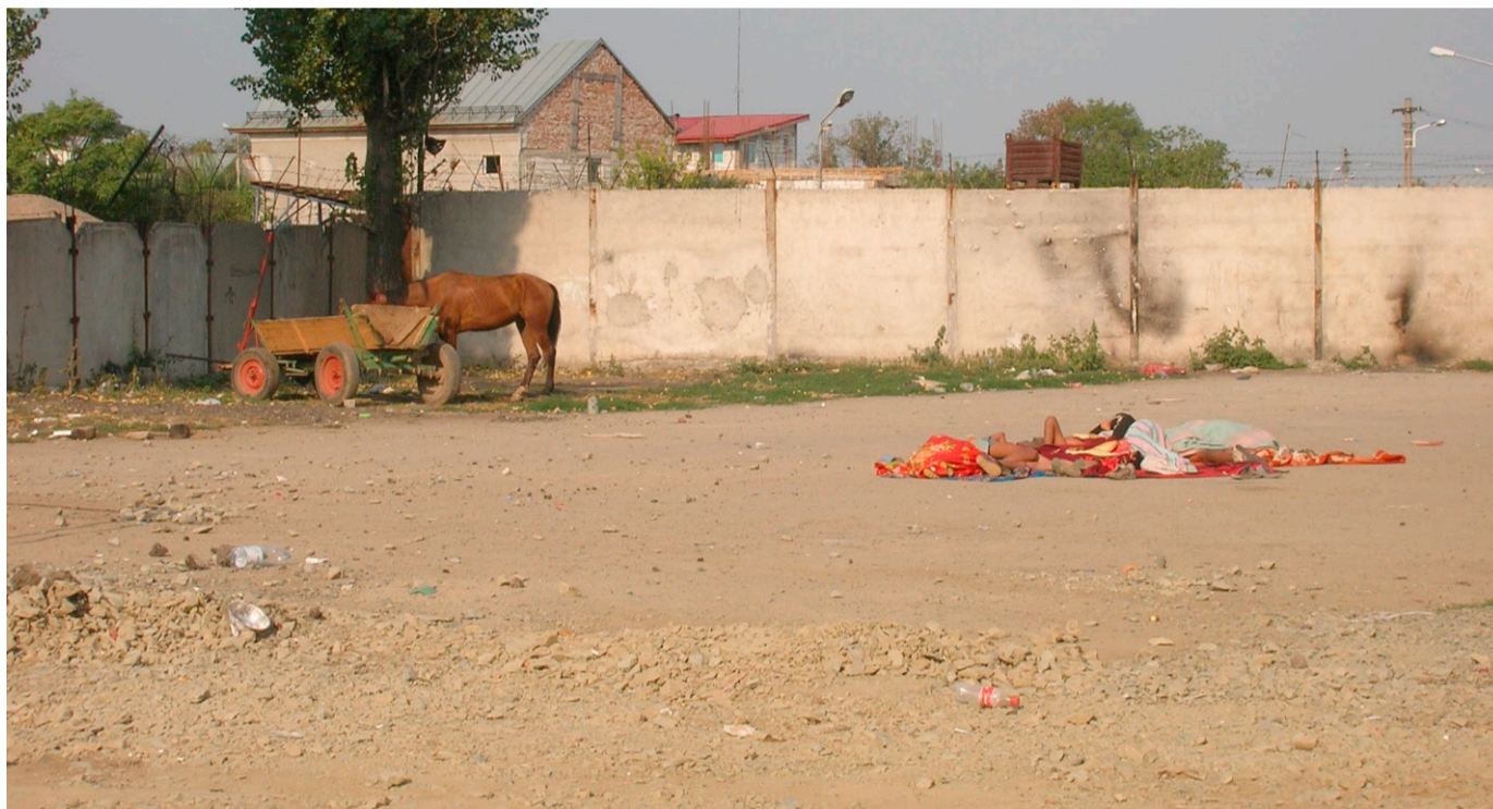
Der Kontrast zu den Bentleys auf Bukarests Strassen: Alltagsbilder aus den Quartieren Rahova und Ferentari – mit Einblick in den von Sucht und Zerfall gezeichneten Müllmeier (oben rechts) und ins «Schlafzimmer» der Trostlosigkeit (unten).